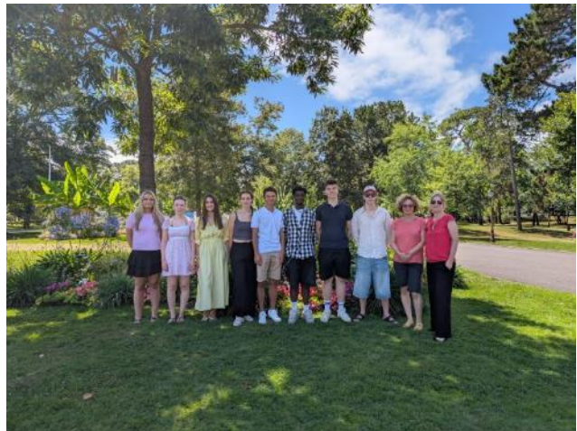
Teilnehmer und Teilnehmerinnen an der Sprachreise Bordeaux 2025 im Park von Arcachon.