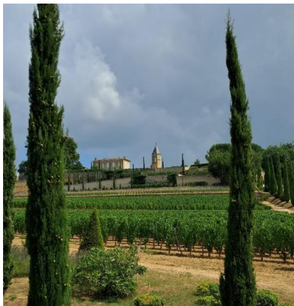
Dune du Pilat.